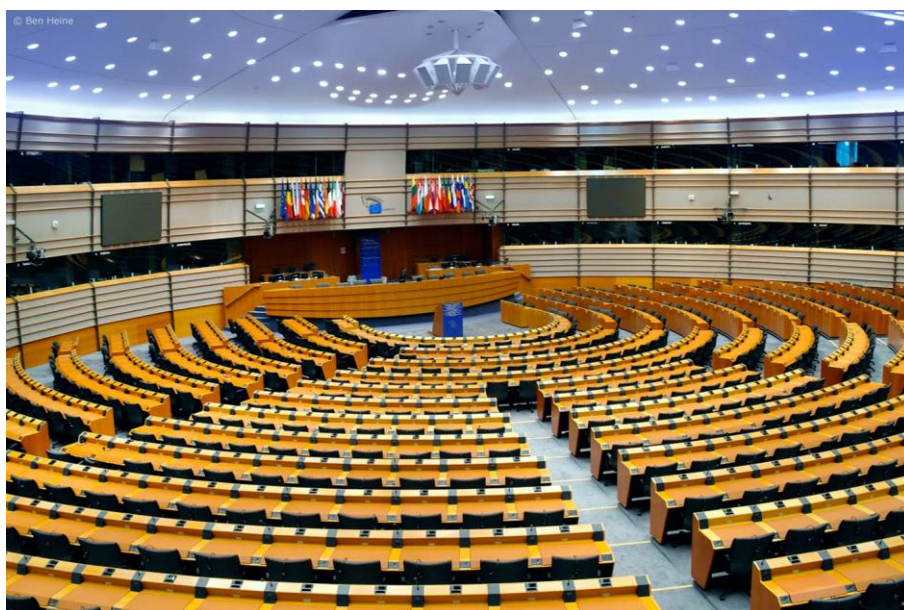
Európai Parlament ( Benjamin Heine )

27. GMO-Kerekasztal ülésén elhangzott hozzászólásokból